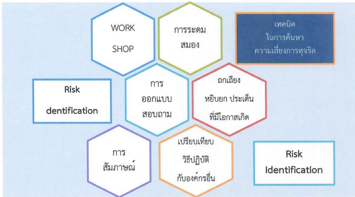
ตารางระบุความเสี่ยง (Know Factor และ Unknown Factor)

เทคนิคในการ ระบุความเสี่ยง หรือค้นหาความเสี่ยงการทุจริตด้วยวิธีการต่าง ๆ ดังนี้